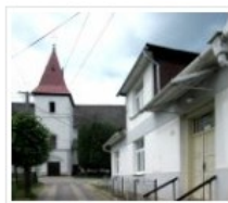
Evangelische Kirche mit Luther-Haus (rechts) in Einsiedel/Mníšek

Wer die Ausstellung in Einsiedel besuchte, vermisste nicht nur vor dem Haus der Begegnung einen entsprechenden Hinweis. Zur Ausstellung gehörendes Informationsmaterial lag nicht vor, ebenso das allgemein übliche Gästebuch. Es ist zu hoffen, dass trotzdem zahlreiche Besucher den Weg zu den Orten dieser interessanten Wanderausstellung finden.