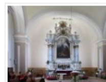
Altar der evangelischen Kirche in Einsiedel

Nicht weit entfernt vom Haus der Begegnung in Einsiedel, rechts vor der ev. Kirche, befindet sich das dortige Martin-Luther-Haus. Es dient als Gemeindehaus. Bei großer Kälte werden Gottesdienste dort und nicht in der dahinter befindlichen Kirche gehalten. Auch die Besichtigung dieser Kirche ist empfehlenswert.