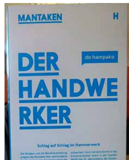
Zu dieser und anderen Tafeln gab es Diskussionen zum Wortumbruch

Verwunderung herrschte aber über die dort benutzte Worttrennung. Dazu ist hier als Beispiel die Tafel für den Buchstaben H wie Handwerk aufgeführt: