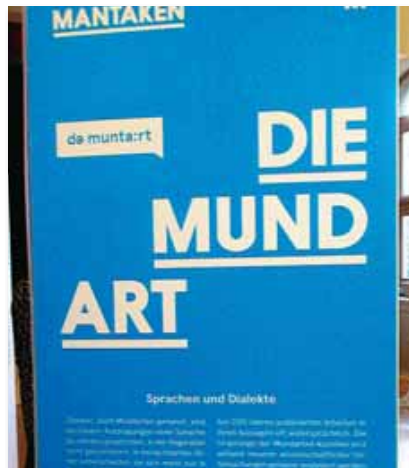
Eine der Ausstellungstafeln