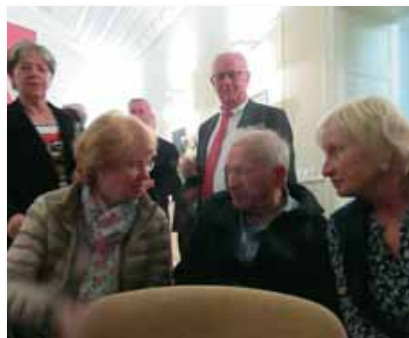
Angeregte Gespräche wurden geführt.

Anschließend gab es genügend Zeit und Gelegenheit, um die Ausstellungsobjekte zu betrachten und über diese untereinander und mit den zahlreichen aus Deutschland angereisten Gästen, darunter auch gebürtige Mantaken, zu diskutieren.