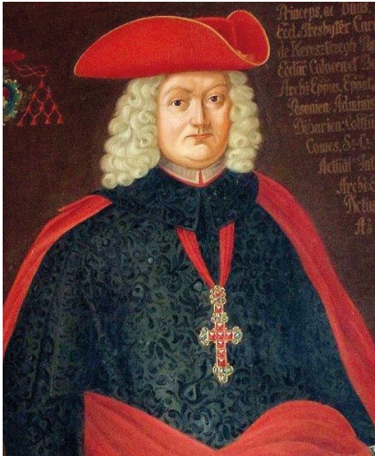
Kardinal Imre Csáky

Die Zipser Burg wurde im 12. Jahrhundert errichtet und später vom böhmischen Adligen Johann Giskra, der von ca. 1400 bis etwa 1470 lebte, ausgebaut. Die Csákys wurden 1639 Herren der Burg und besaßen sie bis zum Ende des Zweiten Weltkrieges.